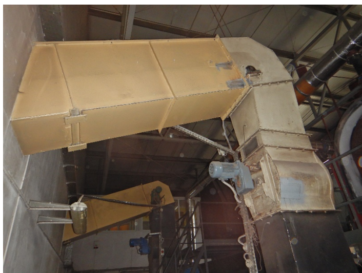
Fot. 9 Widok systemu dostarczania paliwa do modernizowanego kotła