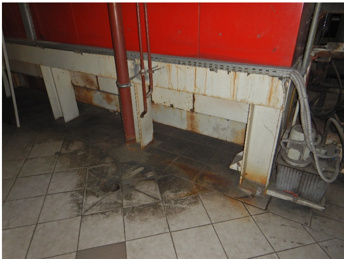
Fot. 3 Widok posadowienia kotła do modernizacji