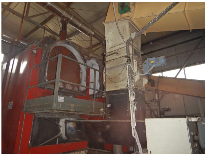
Fot. 2 Widok kotła do modernizacji