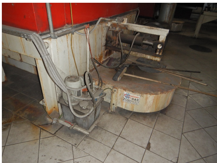
Fot. 4 Widok posadowienia kotła do modernizacji