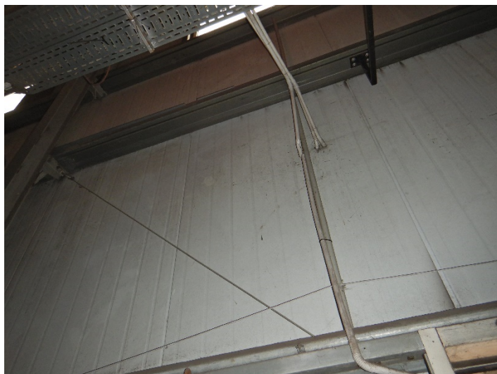
Fot. 7 Widok fragmentu ściany z płyty warstwowej do demontażu i odtworzenia w celu wystawienia oraz wstawienia nowego urządzenia