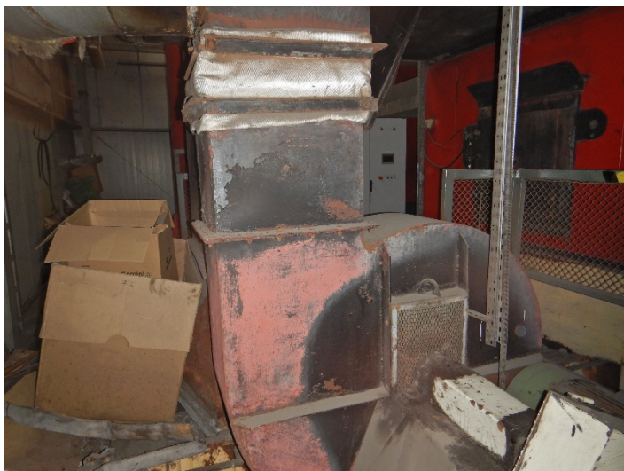
Fot. 5 Widok wentylatora do modernizacji