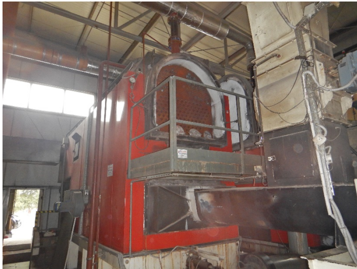
Fot. 1 Widok kotła do modernizacji