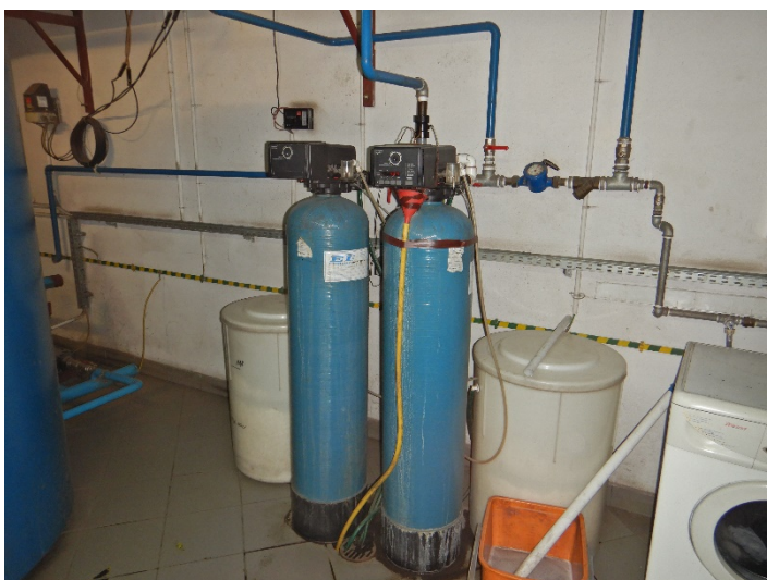
Fot. 8 Widok stacji uzdatniania wody do regeneracji złoża