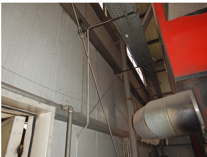
Fot. 6 Widok czopucha kotła do modernizacji